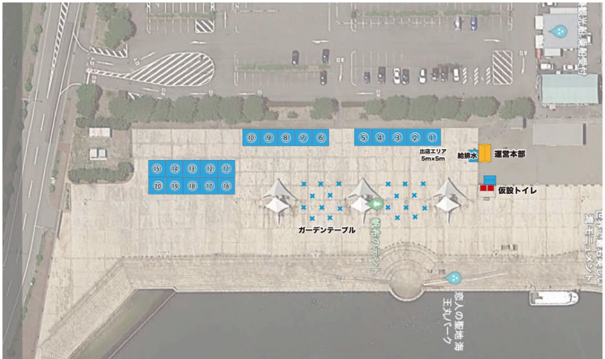
【移動販売車の場合】